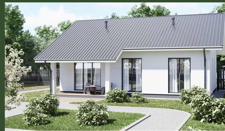
ДОМ С ТЕРРАСОЙ